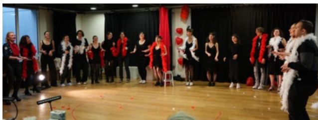
Atelier Choeur en Mouvement