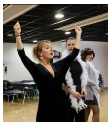
prise de conscience de l'espace Présence scénique