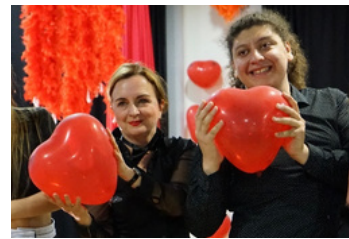
chanter en coeurs